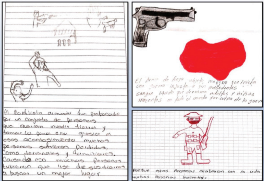
Figura 3. Representación del conflicto armado colombiano.