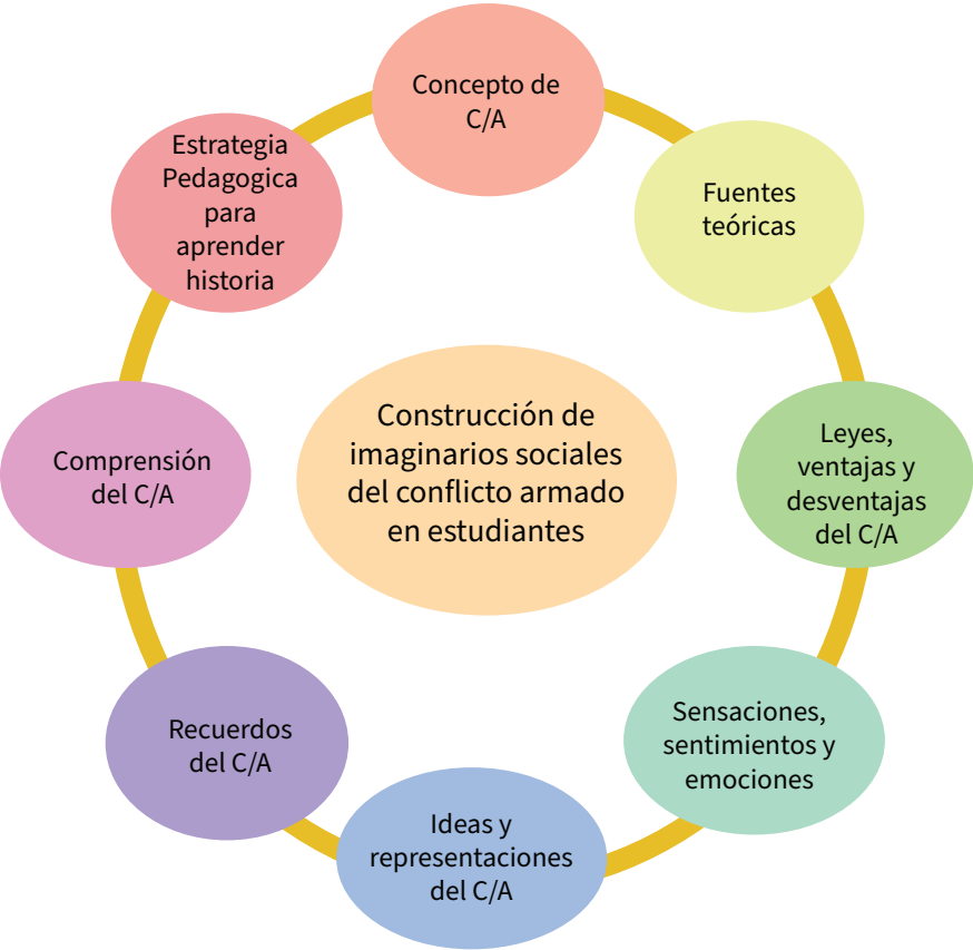
Figura 2 Palabras clave que constituyen los imaginarios de los estudiantes sobre el conflicto armado