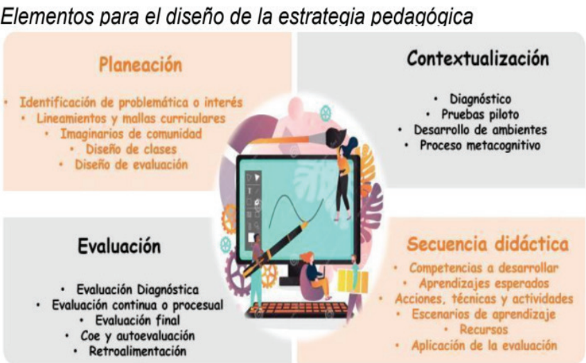
Figura 1. Elementos para el diseño de la estrategia pedagógica.

A continuación, se presenta un esquema en el que se recogen los elementos necesarios para el diseño de dichas estrategias: